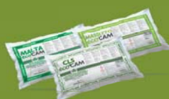
PRODOTTI IN SACCO

Tutto si trasforma e noi lo sappiamo bene perché nei nostri impianti di Ghedi (BS) recuperiamo materiale proveniente dalle demolizioni edili e lo trasformiamo in nuova risorsa da rimettere in produzione. In questo modo garantiamo un ulteriore valore aggiunto alla materia che vive più volte, abbattiamo gli sprechi, riduciamo i consumi e i rifiuti.